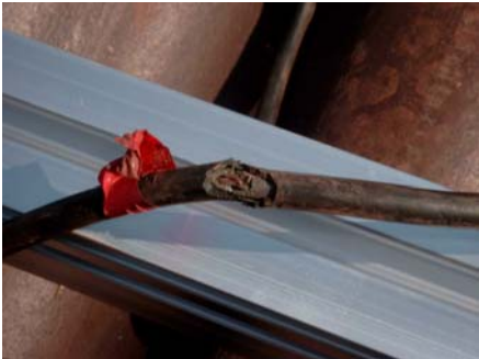
Foto Kabelschaden durch Marderverbiss

In der Praxis erfolgt die Leistungskontrolle der Solarstromanlagen aber sehr lückenhaft. In der Regel wird nur im Nachhinein festgestellt, ob es zu einem Ausfall des Wechselrichters oder zu einem Abfall vom Wirkungsgrad der Solarmodule gekommen ist. Und das auch nur, wenn die erwartete Menge nicht mit der tatsächlich verkauften Menge übereinstimmt.