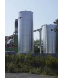
Pflanzenölanlage E.MA.CON in Lustenau

* „die neue Umwelt“, Energie aus Wasserstoff, Nr. 3/2004