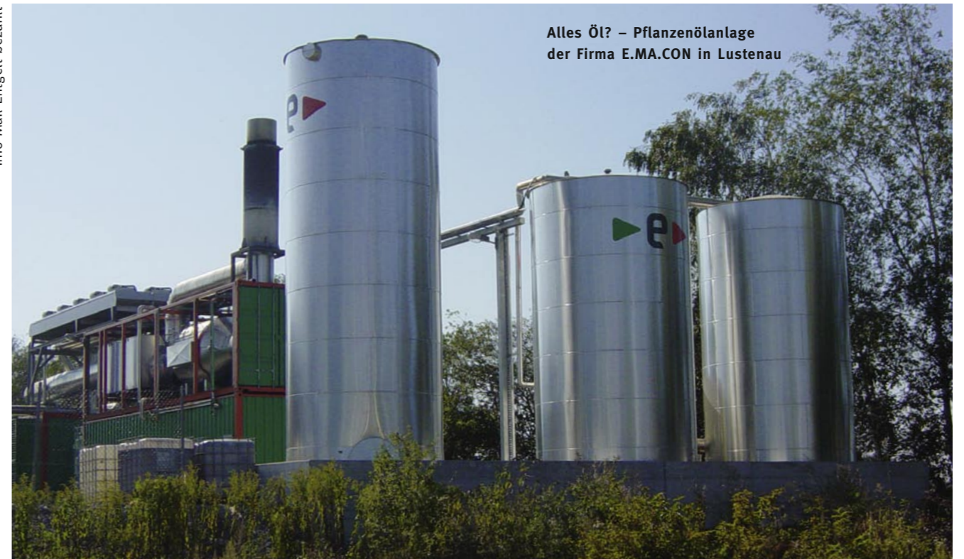
Alles Öl? – Pflanzenölanlage der Firma E.MA.CON in Lustenau

Österreichische Post AG Info Mail Entgelt bezahlt